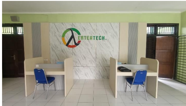
Gambar 3: Suasana ruang layanan Centertech sebagai unit praktik Teaching Factory siswa Teknik Komputer dan Jaringan

Di program Teknik Komputer dan Jaringan, TF dijalankan melalui unit layanan "Centertech". Siswa mengerjakan proyek riil seperti perbaikan komputer, perbaikan jaringan internet, dan pengembangan aplikasi untuk kebutuhan internal sekolah maupun klien eksternal. Kegiatan ini dikombinasikan dengan mata pelajaran produktif seperti Teknologi Jaringan sehingga pembelajaran berorientasi proyek nyata sesuai dengan prinsip learning by doing dalam Teaching Factory.