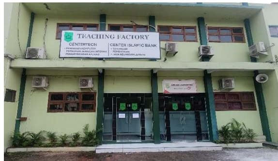
Gambar 1: Tampak depan Gedung Teachig Factory SMK Islamic Centre Baiturrahman Semarang yang menaungi Centertech dan Center Islamic Bank

Program Perbankan Syariah mengoperasikan unit “ Center Islamic Bank ”, yaitu sebuah ruang belajar praktis yang dirancang seperti bank syariah mini. Siswa terlibat dalam transaksi nyata: pembukaan rekening, pencatatan tabungan, pelayanan teller, hingga pengelolaan kas harian berdasarkan prinsip syariah. Kegiatan ini diawasi guru produktif Perbankan Syariah, namun siswa bekerja secara mandiri sesuai jadwal.