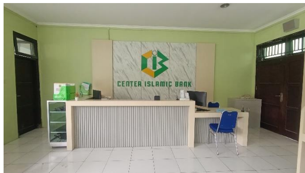
Gambar 2: Suasana ruang layanan Center Islamic Bank sebagai unit praktik Teaching Factory Perbankan Syariah

Unit Center Islamic Bank ini beroperasi dengan metodologi Teaching Factory yang mengintegrasikan teori perbankan syariah dengan kegiatan operasional bank nyata di sekolah. Siswa mengambil peran-peran kerja seperti teller, customer service, dan administrasi pembiayaan, menjalankan tugas secara bergiliran sesuai jadwal yang telah ditentukan. Dalam pelaksanaannya, siswa dituntut berpenampilan rapi, menjaga sopan santun dalam pelayanan, serta mengikuti prosedur transaksi sesuai standar perbankan syariah.